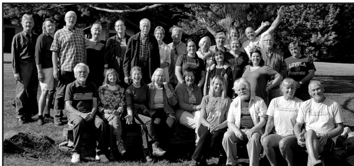
Visa stovyklautojų ir lektorių komanda: dalyvavome, sužinojome, mokėmės ir džiaugėmės.