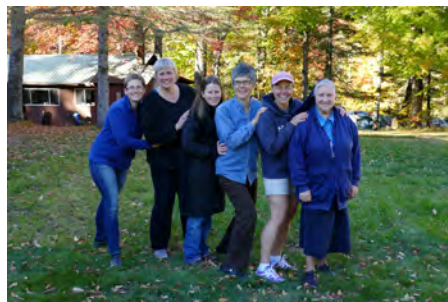
All current and previous Neringa Executive Directors!